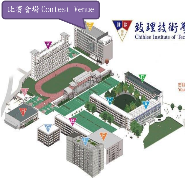
圖 1 校園導覽圖