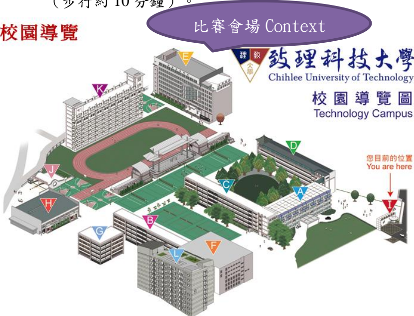
圖 1 校園導覽圖