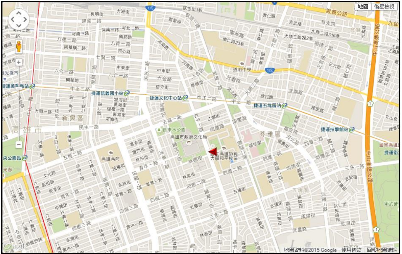
圖 1 國立高雄師範大學電子地圖(高雄市苓雅區和平一路 116 號)