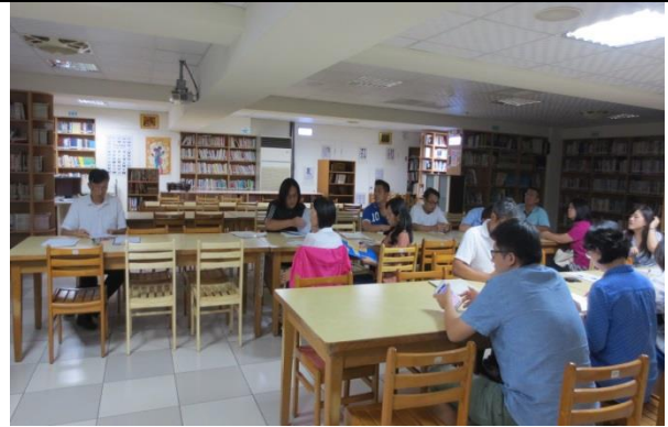
與會同仁認真聆聽