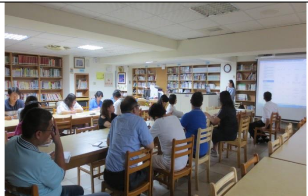
與會同仁認真聆聽