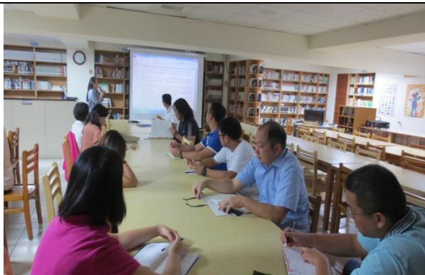
與會同仁認真聆聽