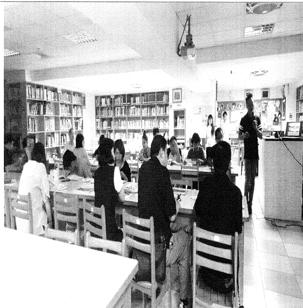
余作庸組長重要業務傳達報告