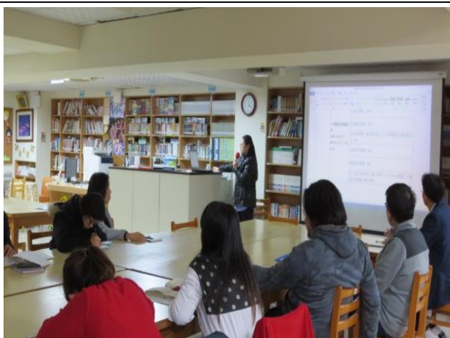
與會同仁認真聆聽