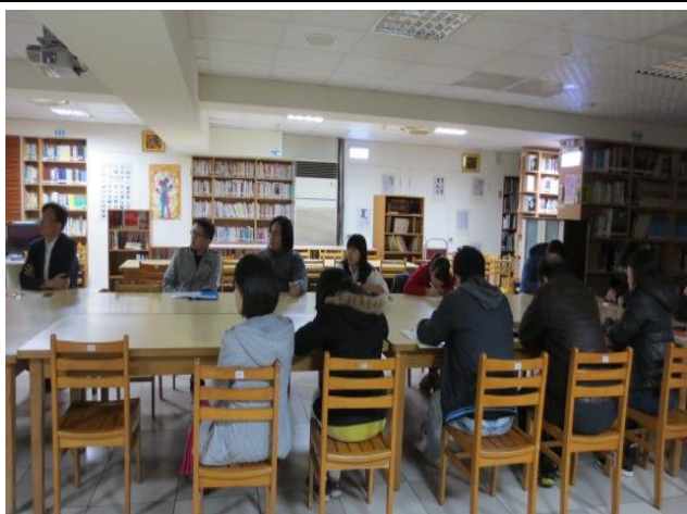
與會同仁認真聆聽