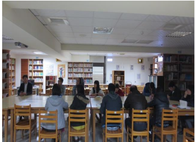
與會同仁認真聆聽