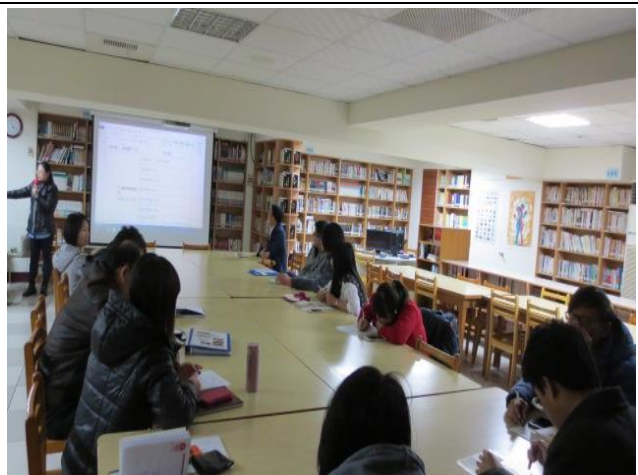
與會同仁認真聆聽