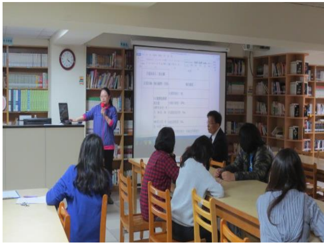
實驗研究組長報告