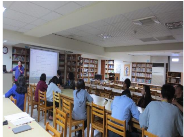
與會同仁認真聆聽