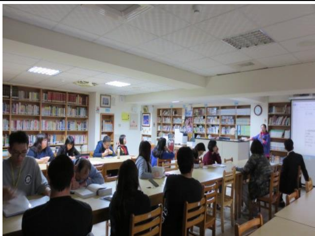
與會同仁認真聆聽