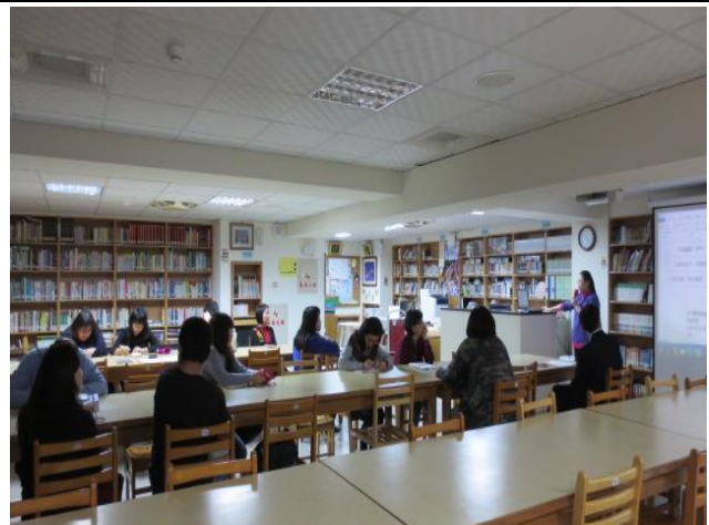
與會同仁認真聆聽