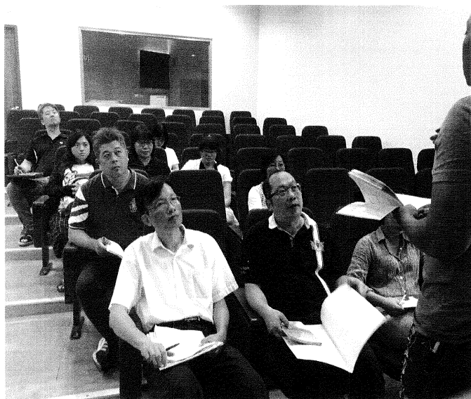
建教組長業務報告