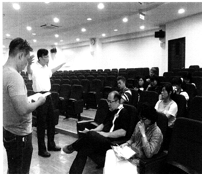
校長與老師協調溝通