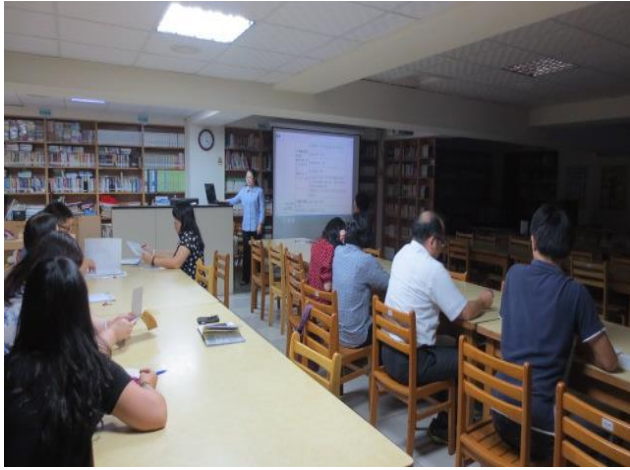
實驗研究組長報告