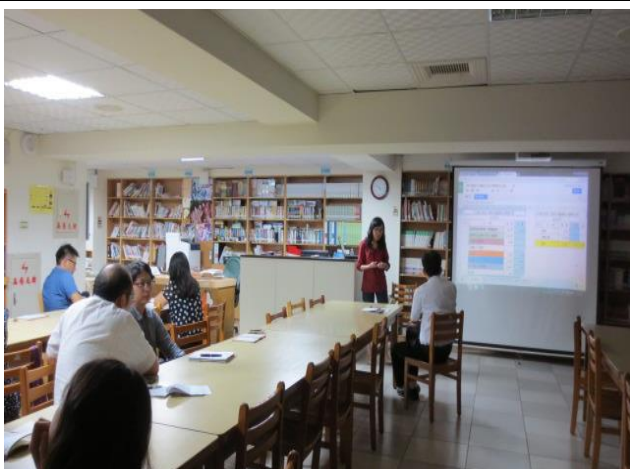
校長與會計主任討論資本門剩餘款