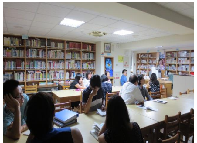
與會同仁認真聆聽