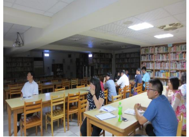
與會同仁認真聆聽