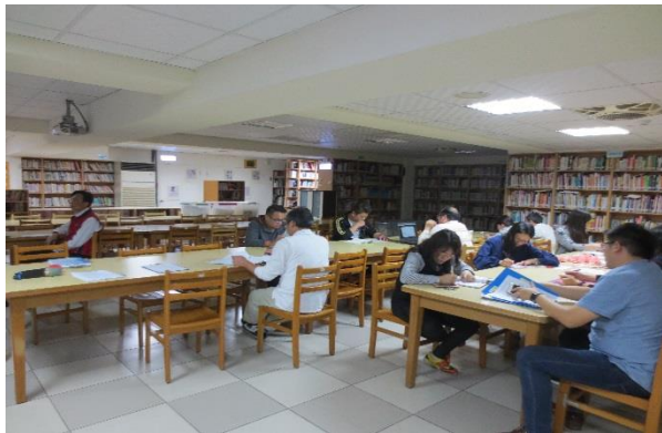
與會同仁認真聆聽