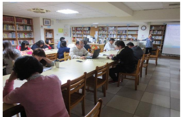
與會同仁認真聆聽