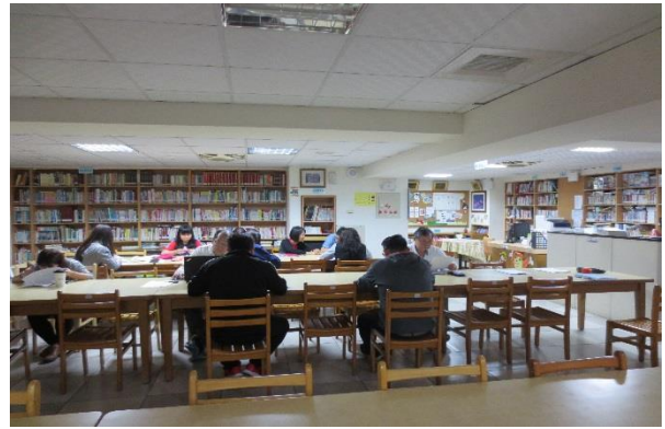
與會同仁認真聆聽