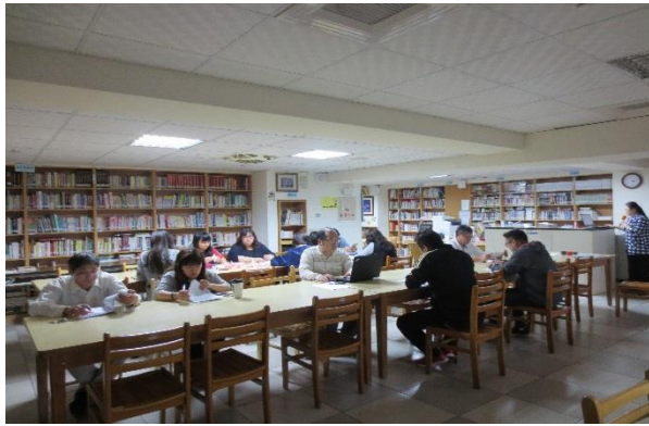
與會同仁認真聆聽