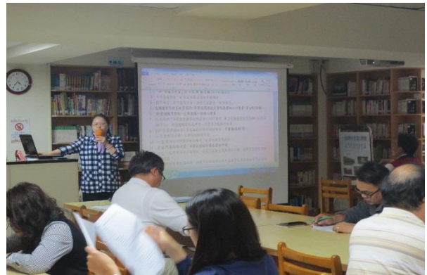
實驗研究組長報告