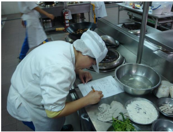
認真填寫食譜及創作理念