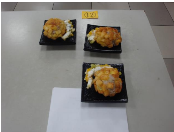
第三名 炸芋泥水果吐司丁