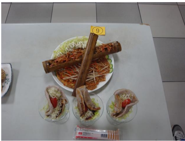
第一名 風水畫竹筒飯