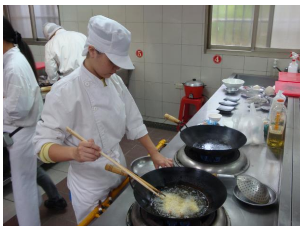
食材備妥且注意衛生