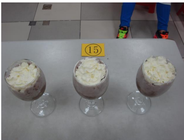
佳作 巧克力芋頭蒙布朗