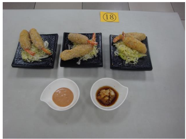
第二名 芋頭泥炸蝦