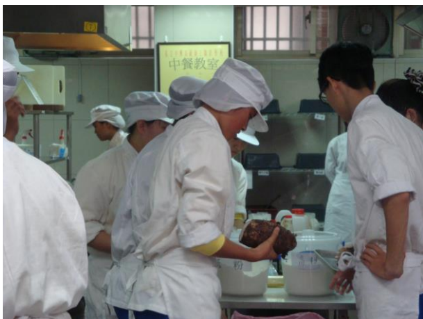
選手自備各式創意食材