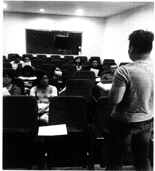
組長與導師溝通學生問題