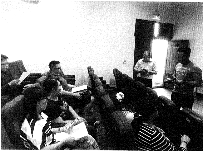
建教組長業務報告